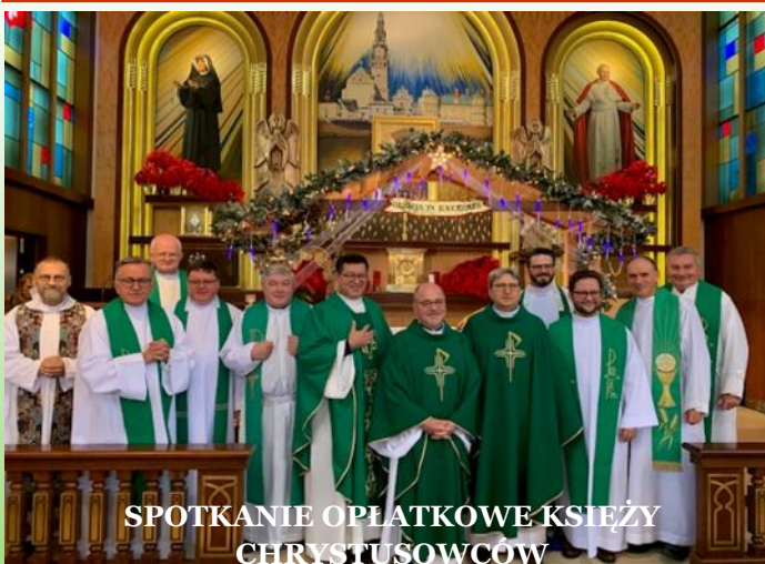
SPOTKANIE OPLATKOWE KSIĘŻY CHRYSUSOWCÓW

Zapraszamy wszystkich serdecznie do udziału w tym marszu który promuje piękno i wartość ludzkiego życia od poczęcia do naturalnej śmierci. Jest to wydarzenie w którym biorą udział całe rodziny, mamy nadzieję że niezabraknie rodzin z naszej wspólnoty.