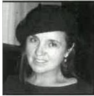
CALL/TEXT: (818) 792-3715